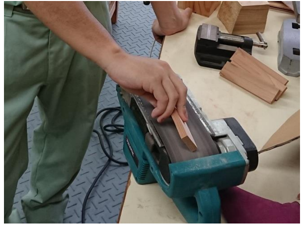
② ベルトサンダーを使用して、大まかにやすり掛けをします。