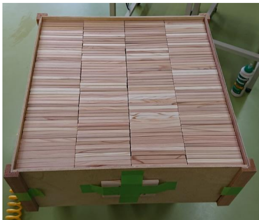
⑤ 積木 1,000 枚作りました！