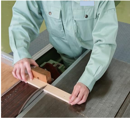
① 厚さと幅を揃えた後、同じ長さに切り揃えます。