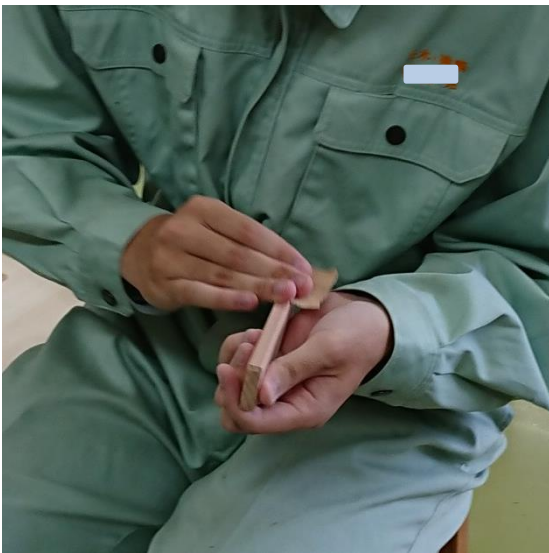
③ さらに、手に刺さったりしないように、1枚1枚やすり掛け。