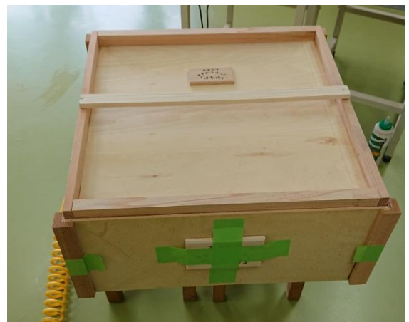
⑥ ふたも製作して完成！！