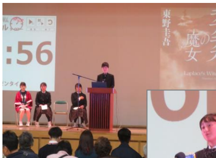
↑ステージ上でのプレゼン

ビブリオバトル」が行われました。第1アリーナという大きな会場で行うのは初めてのことで、担当した図書委員もとても緊張しました。審査する観戦者が予想を上回る人数となり、4人のバトルのプレゼン内容はどれも素晴らしく、結果は接戦でした。1回目ということで反省点もありましたが、ぜひ来年以降も続けて行いたいと思いました。