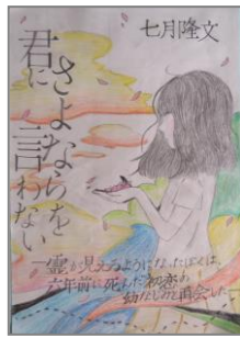
『君にさよならを言わない』