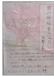
『君の臍臓をたべたい』